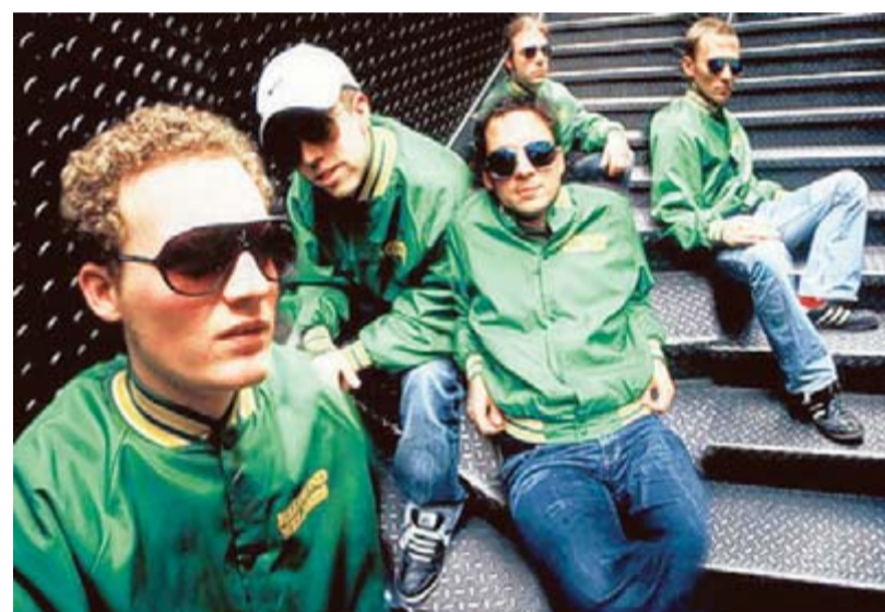
Funk- und Discogrooves stehen bei „Jive Injector“ im Vordergrund: Sie sind Headliner des Bruckfelden-Open-Air am 15. Juli.

(Funk-Rock, 23.30 bis 1 Uhr) Funk- und Discogrooves veredelt mit Elementen aus Latin und Jazz: Bei „Jive Injector“ ist alles möglich. Relaxed zurücklehnen, angeregt mit dem Fuß wippen, aber auch richtig abtanzen. Phantasievolle Arrangements bilden den Rahmen für Improvisationen, die den Zuhörer auf Reisen mit noch